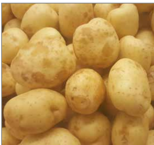
Knolle wat losskil en verbruining toon