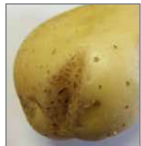
Spleete wat deur Streptomyces (links - foto: LNR) en Rhizoctonia (regs - foto: ASD) veroorsaak word