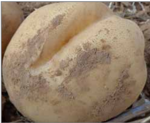
Knolweefsel bedek met skil