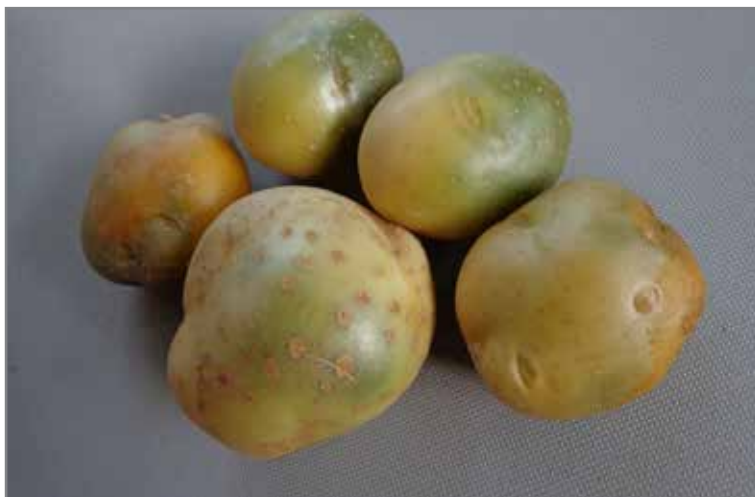
Knolle met verskillende grade van vergroening