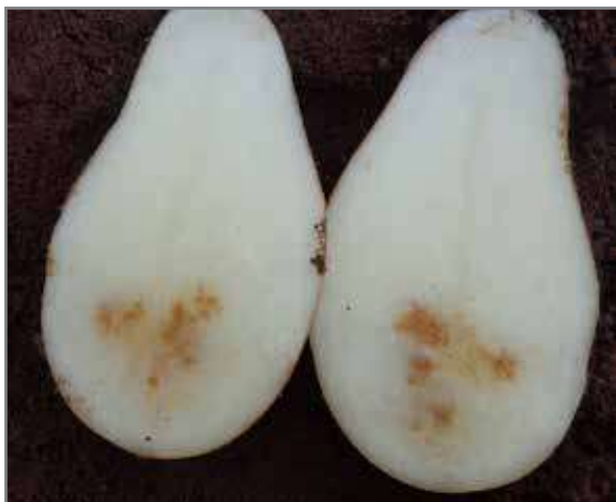
Bruinvlek wat naby die apikale gedeelte van groot knolle voorkom (bo en onder)