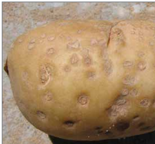
Vergrote lentiselle wat ugedroog het