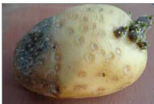
Simptome van sagtevrot-patogene wat die knol deur vergrote lentiselle binnegedring het