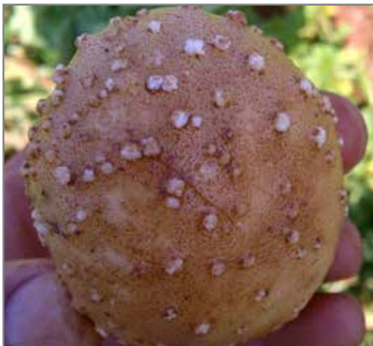
Knol met wit, kallusagtige weefsel