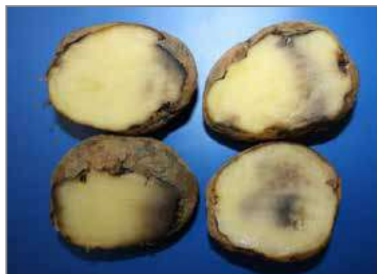
Knolle wat simptome van koueskade toon