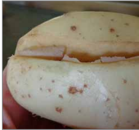
Sandspleet wat ontblote knol weefsel toon