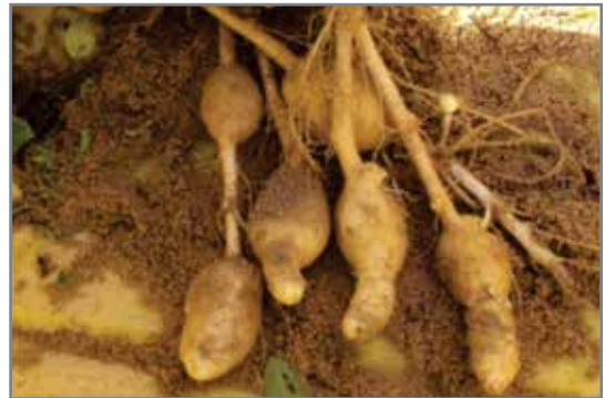
Knolle in kettingvorm op en stolon