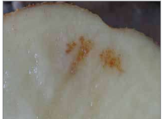
Bruinvlek van naderby