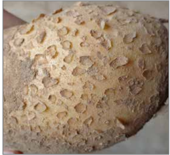
Knolle met verskillende grade van skilkraak (bo en links onder)