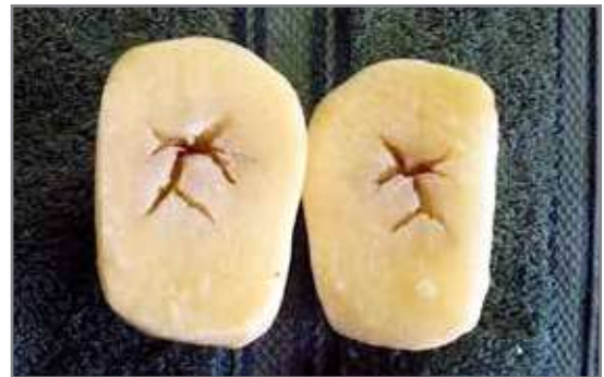
Holhart met onreëlmatige vorm