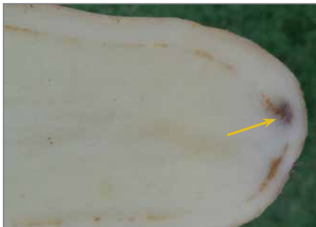
Nekrotiese weefsel as gevolg van vaatbundelverbruining