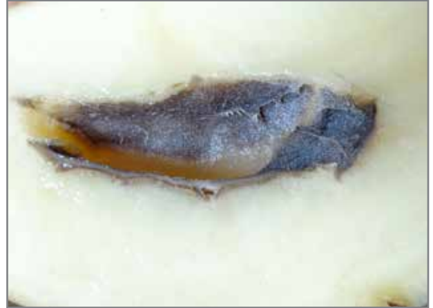
Swarthart het ontwikkel om 'n holte te vorm. Weefsel wat die holte uitvoer is leeragtig of hard