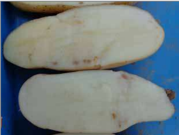
Bruinvlek wat in die vaatbundel voorkom