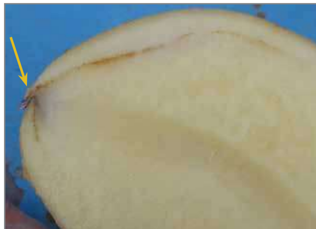
Vaatbundelverbruining wat vanaf die stolon-ent ontstaan