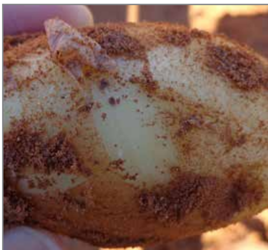
Die skil van onvolwasse knolle word maklik verwyder