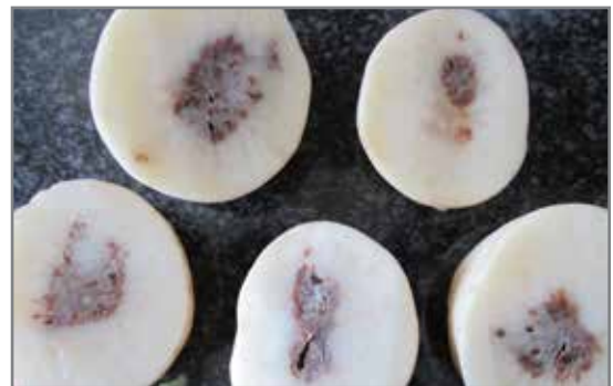
Holhart wat deur bruinkern voorafgegaan is